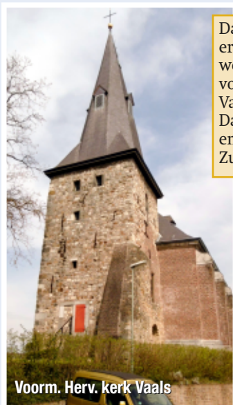
Voorm. Herv. kerk Vaals

Dankzij deze buitendag wordt er na 67 jaar voor het eerst weer een lutherse dienst in de voormalige Lutherse kerk Vaals gevierd! Dat op zich is al heel bijzonder en een reisje naar het uiterste Zuiden waard.