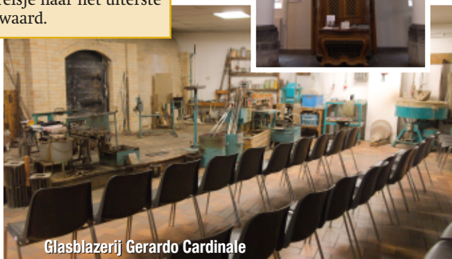
Glasblazerij Gerardo Cardinale

Dankzij deze buitendag wordt er na 67 jaar voor het eerst weer een lutherse dienst in de voormalige Lutherse kerk Vaals gevierd! Dat op zich is al heel bijzonder en een reisje naar het uiterste Zuiden waard.