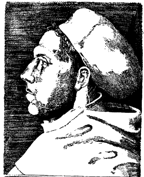
LVCAE • OPVS • EFFIGIES • (HAEC) • EST • AGRI • TVRA • I • V • THERI • AETHERNAM • MENTIS • EXPRIMIT • IRSE • SVAE • M • D • X • X • I • Luther (mit dem Doktorbarrett) Kupferlich von Lucas Cranach d. Ä. (1521)

En die maaltijd wordt ook een heel speciale verrassingsmaaltijd omdat we een